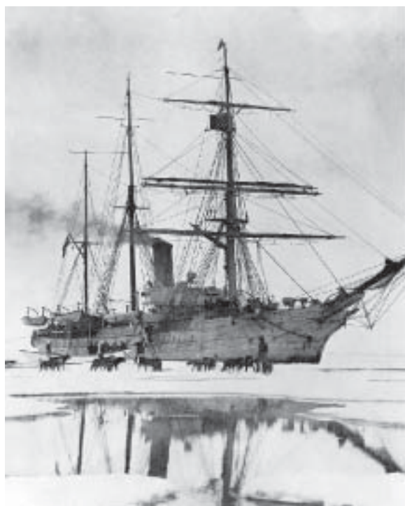
«City of New York»