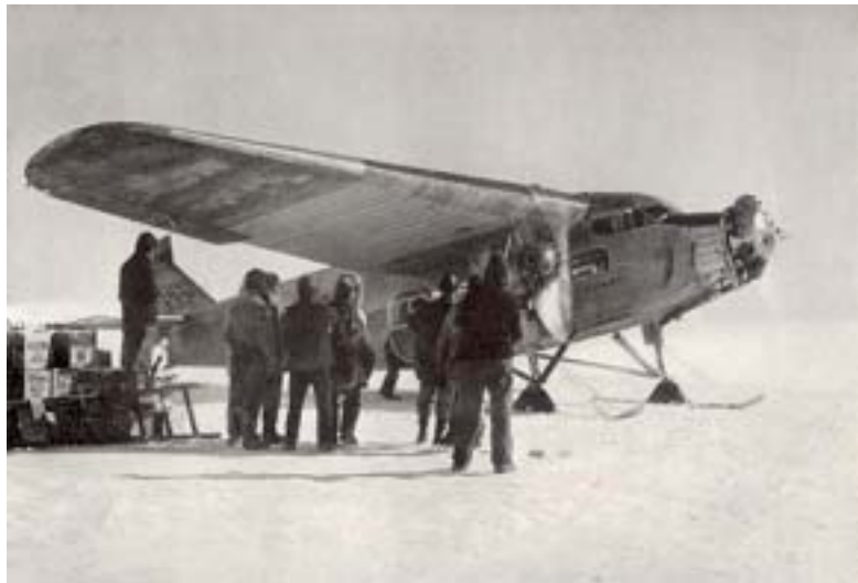
Die «Floyd Bennett» ist startklar zum Südpol