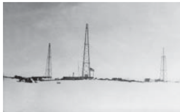
«Little America», Sendemasten

Das Hauptziel dieser Expedition war aber der Flug zum Südpol, der am 28 und 29. November 1929 stattfand. Das 3-motorige Flugzeug «Floyd Bennett» startete mit dem norwegischen Piloten Bernt Balchen in «Little America» und erreichte nach neun Stunden den Südpol. Beim Überflug und der Umrundung des Südpols wurde vor dem Rückflug die amerikanische Flagge abgeworfen. Erstmals nach Amundsen und Scott 1911-12 gelangten Forscher wieder an den Südpol, jedoch dauerte es nochmals fast 30 Jahre bis am 31. Oktober 1956, unter