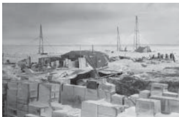
«Little America», Camp