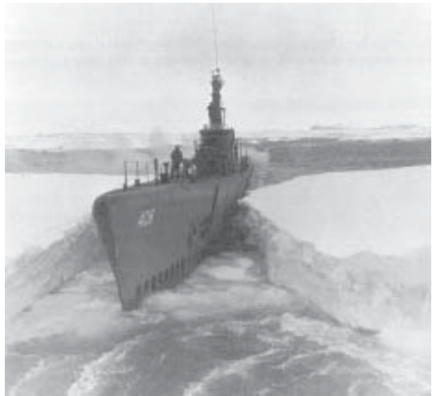
Das U-Boot «Sennet» nach Kollision mit Eisberg

Die vierte Antarktisexpedition lief unter dem Namen Operation «Highjump». Die Operation «Highjump» war ein Einsatz der US-Marine in der Antarktis, die am 2. Dezember 1946 im US-Kriegshafen Norfolk startete und am 27. Januar 1947 den US-Stützpunkt «Little America IV» in der Ross Sea einrichtete. Von dort starteten Erkundungsflüge. An der Operation «Highjump» beteiligten sich 13 Schiffe und 26 Flugzeuge. Insgesamt wurden über 70.000 Luftaufnahmen gemacht. Am 3. März 1947 wurde die Expedition von Admiral Byrd für beendet erklärt. Es war die grösste militärische Operation in diesem Teil der Antarktis und eine der grössten Einzelexpeditionen zur Erforschung der Antarktis. Über 4700 Personen nahmen an dieser Expedition teil.